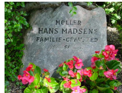
Stenen stod oprindeligt på familiegravstedet på Asminderød Kirkegård indtil gravstedet blev sløffet i foråret 2018.