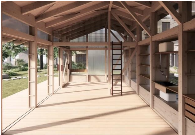
Et kik ind i en tilsvarende hytte (Realdania)

Det går fremad med projektet, men der er desværre enkelte "bump på vejen."