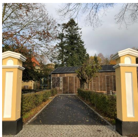
Indgangen til Egedal, Byens Hus

På næste bestyrelsesmøde, der afholdes den 13.marts, vil detaljerne for generalforsamlingen blive endeligt fastlagt. Derpå vil vi hurtigt udsende indkaldelse med dagsorden, samt indbydelse til det kulturelle indslag, vi håber at kunne bringe i forbindelse med generalforsamlingen. Traditionen tro, veksler vi mellem bysamfundene. I 2022 var vi i Fredensborg, i 2023 i Karlebo, 2024 i Humlebæk, og i år altså i Kokkedal. Notér gerne allerede nu dato og sted: Onsdag den 9.april kl. 19:30 i Egedal, Byens Hus, Egedalsvej 2, 2980 Kokkedal.