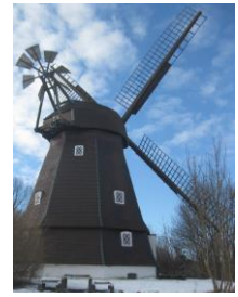
Karlebo Mølle 05.oktober 2025

udsendes efter behov til Historiske møllers venner Fredensborg Møllelaug