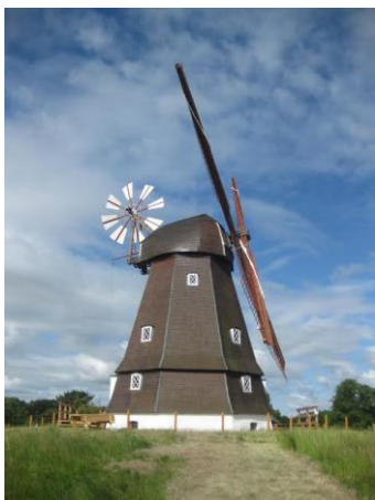
Karlebo Mølle, Kirkeltevej 161C, 2980 Kokkedal

Karlebo Mølle, der blev fredet i 1950, ligger højt på en bakketop, og der er kun adgang til fods.