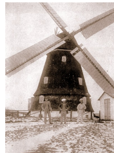
ca 1915 (arkivfoto)